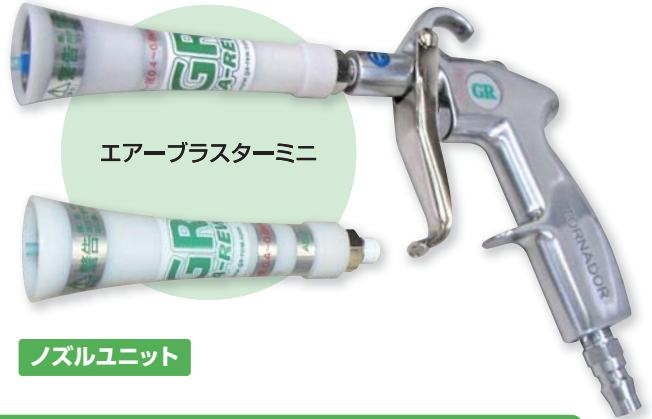
エアースターミニ