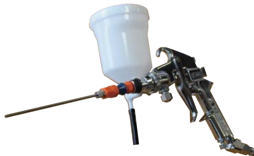
SH-FN (フリーアングル・ボトル)