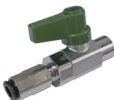
▲オン・オフバルブ