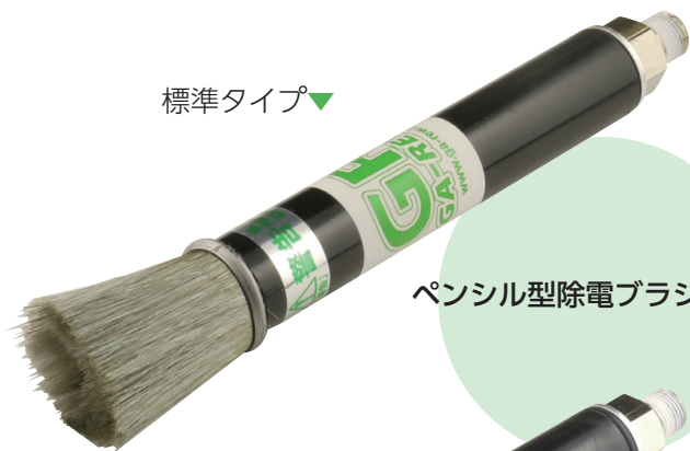
ペンシル型除電ブラシノズル