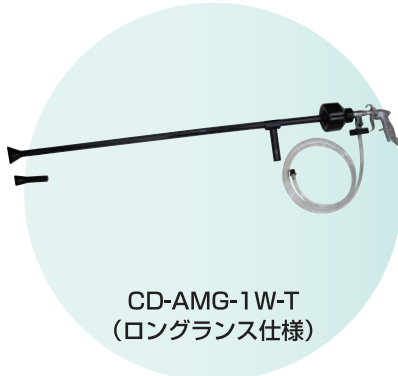
CD-AMG-1W-T (ロングランス仕様)