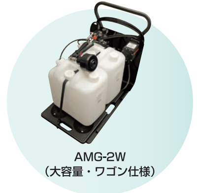
AMG-2W (大容量・ワゴン仕様)