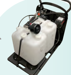
AMG-2W (大容量・ワゴン仕様)