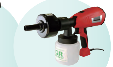
AMG-ME (100 ボルト電動仕様)